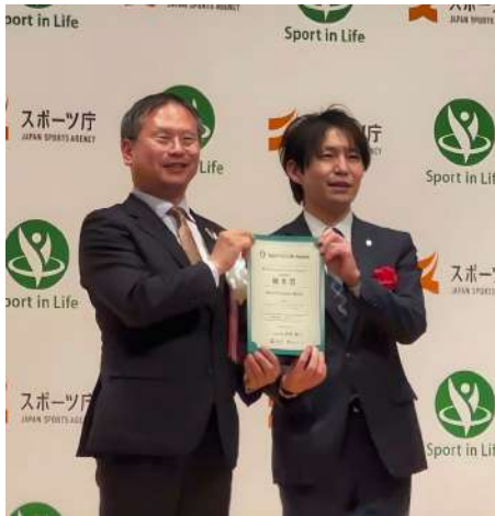
↑写真は表彰式の様子です

スポーツインライフアワードの表彰式では受賞各社による事例紹介も行われ、業種や規模を問わず、それぞれの職場に根ざした健康促進の取り組みに触れることができました。弊社と同様に、現場で体を使う職人・技術職の職業病対策や、社員が自発的に運動習慣を築いていく取り組みが多く紹介されており、同じ現場目線から共感できる事例も数多く発表されました。 社員による記録の見える化・複数の取り組みを組み合わせることで習慣定着率が高まるという研究結果など、今後の弊社の活動に活かせるヒントも多く得ることができました。今回の受賞は、これまでの取り組みへの評価であるとともに、新たな視点をいただく貴重な機会となりました。引き続き、社員一人ひとりが健康と自然に向き合える職場づくりを進めてまいります。