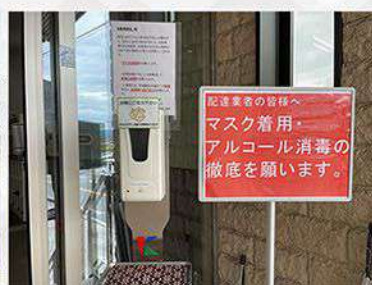
アルコール消毒液の設置