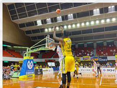
香川県プロバスケットボールチーム 香川ファイブアローズ