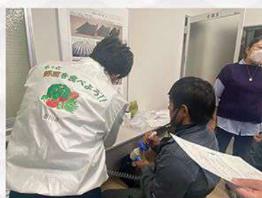
健康をテーマとした研修の実施