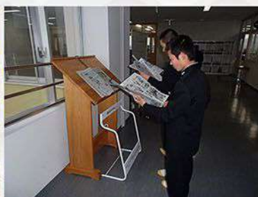
まんのう中学校 「新聞受け」寄贈