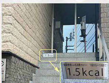
階段にカロリーステッカーを設置