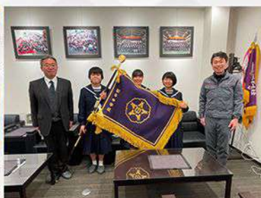
琴平中学校 「校旗」寄贈