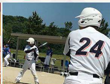
香川県ソフトボールチーム KSC丸亀