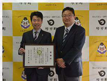
琴平町 「琴平町まちづくり施策」への寄贈