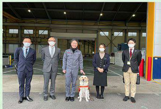
公益財団法人日本盲導犬協会支援