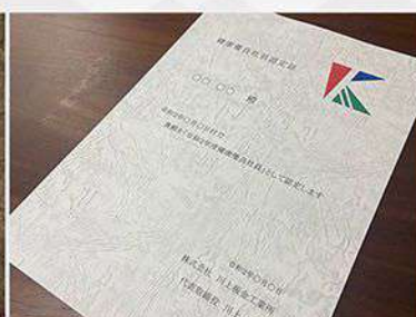
健康優良社員インセンティブ制度の導入