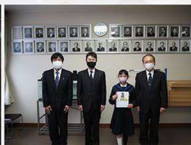
四条小学校 「大型水槽魚飼育セット」「ハードル」寄贈