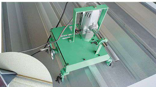
シーマによるハゼ本締め