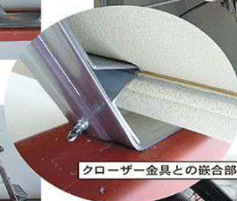
クローザー金具との嵌合部分