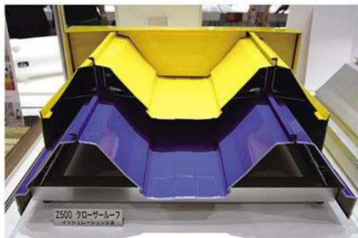
※写真は、Z500クローザールーフ インシュレーション工法

インシュレーション工法は、上下屋根材の間に断熱材を敷込み、熱エネルギーの損失を防ぐ省エネ工法です。