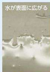
水が表面に広がる スーパーバリア カラーGL