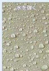
水を弾く 一般カラー

親水テスト スーパーバリアの 親水性と一般カラ ーの撥水性、表面 性能の違いを水 浸漬テストにて確 認しました。