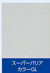
スーパーバリア カラーGL